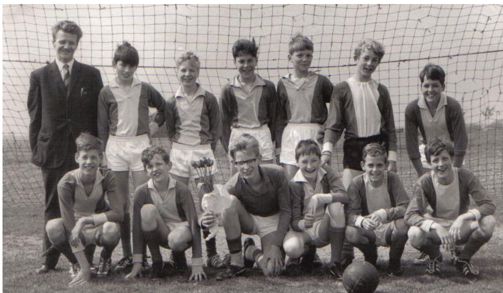
Adspiranten E (ongeslagen kampioen in het seizoen 1965-1966)

In het seizoen '65-'66 telt RKAFC 8 seniorenelftallen. Daarnaast zijn er 7 junioren- en 11 adspirantenelftallen. Er wordt slechts één elftal kampioen, namelijk Adspiranten E. Het eerste elftal eindigt in de 3 e klasse in de middenmoot.