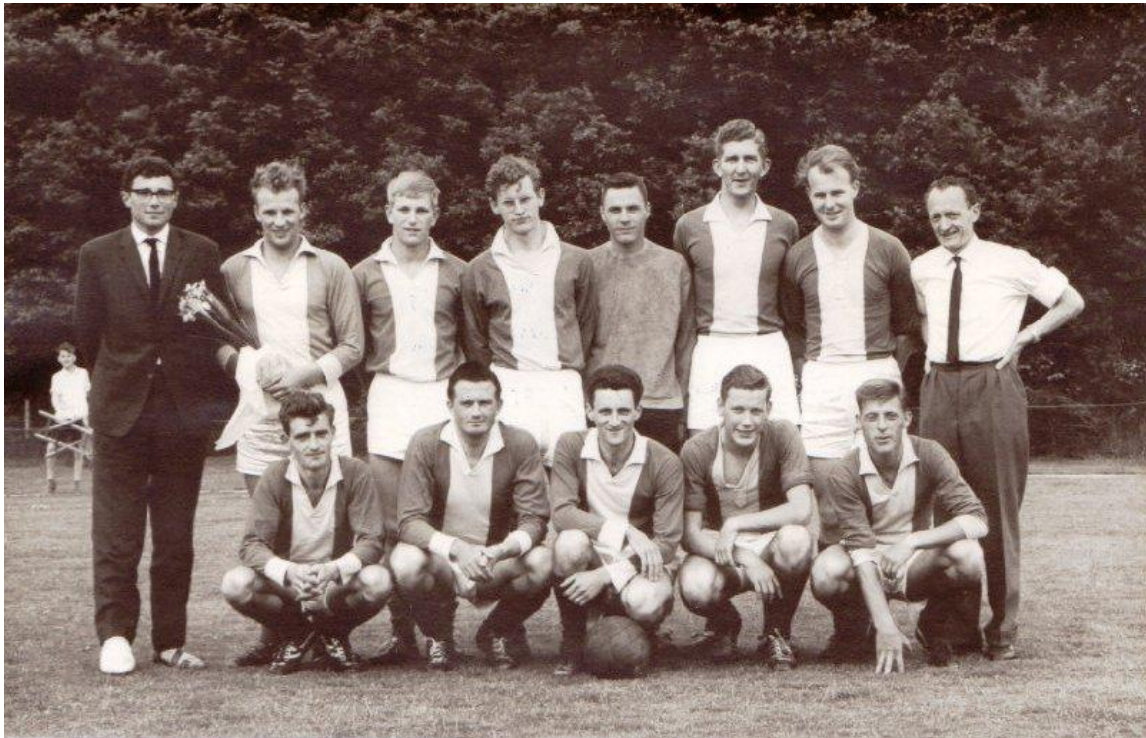
Het tweede elftal van RKAFC in 1965