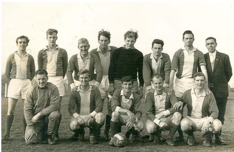
Het kampioenselftal van '64-'65

Hetgeen al jaren gehoopt werd, wordt aan het einde van het seizoen inderdaad werkelijkheid. Het eerste wordt kampioen, en promoveert naar de 3 e klasse. Het kampioenschap wordt binnengehaald na de uitwedstrijd tegen VVW. Maar liefst twintig bussen met supporters begeleiden de spelers naar Wervershoof. Terug in Alkmaar wordt er op grootse wijze feest gevierd. Dit feest vindt plaats in de omgeving van hotel Centraal aan het Hofplein.