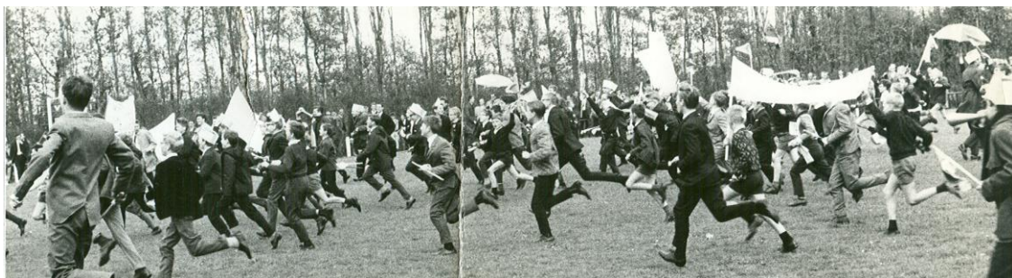
Feestende supporters meten na de kampioenswedstrijd