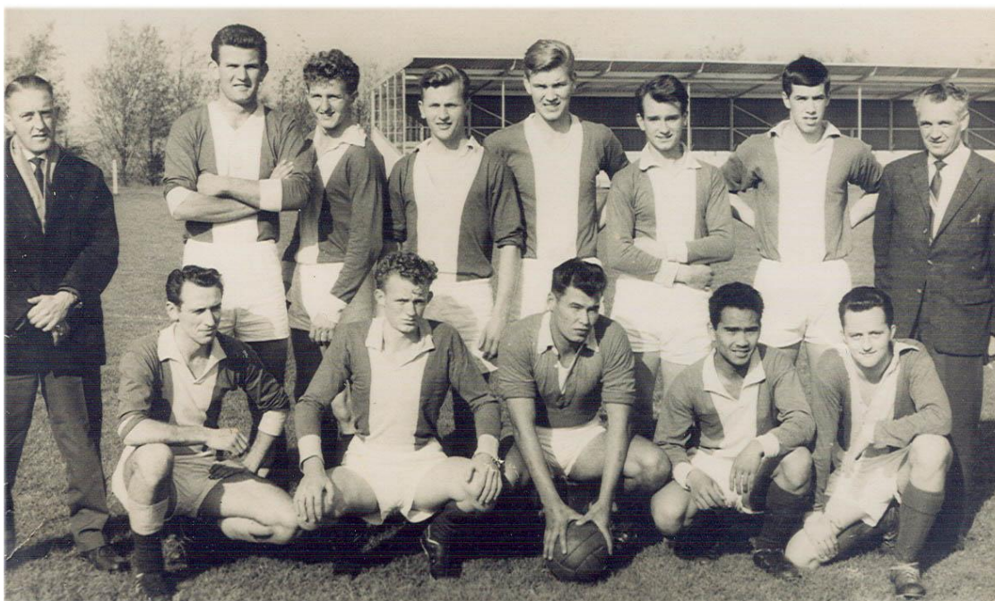
Het tweede elftal van RKAFC ca. 1962

In het seizoen '61-'62 gebeuren niet al te veel opvallende zaken. Het belangrijkste feit uit het seizoen is het gereedkomen van "de ongetwijfeld zeer fraaie tribune. Hierdoor is ons complex, op de beplanting en de uitbreiding met nog 2 velden na, compleet."