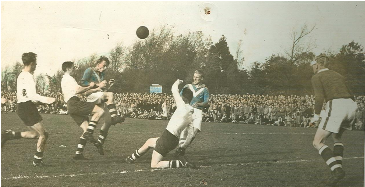
Een actiefoto uit oktober 1954

Het betreft hier de derby tegen Alcmara Victrix. De wedstrijd werd verloren met 1 - 4.