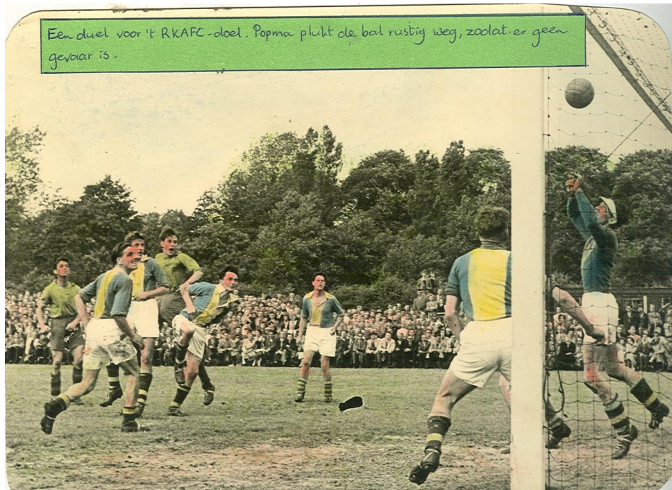
Een spannend moment uit een van de twee wedstrijden tegen EVC

Een ander hoogtepunt is het kampioenschap van het eerste elftal, dat na een spannende competitie, met DTS als belangrijkste mededinger, behaald wordt, en de daaropvolgende promotie van het eerste elftal naar de 3 e klasse, na een tweetal spannende promotiewedstrijden tegen concurrent EVC.