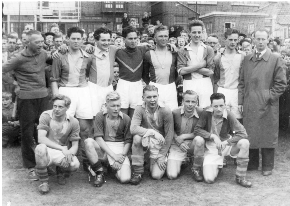
Het eerste elftal: Kampioen van de 4 e klasse, seizoen '53-'54